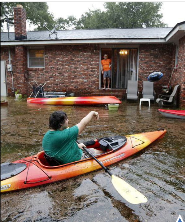
به دنبال سیل شدید در ایالت کارولینای جنوبی، اوباما در این ایالت وضعیت اضطراری اعلام کرد.

یک سازمان غیرانتفاعی حامی حقوق دوچرخه سواران در شیلی در حرکتی نمادین مکان‌هایی که دوچرخه سواران در آنجا دچار سانحه شده‌اند را نشانه گذاری کرده است.