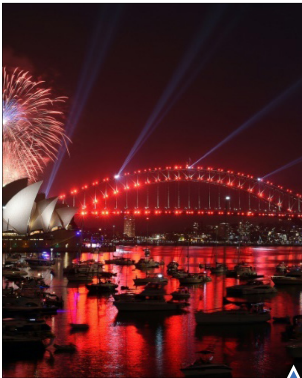
آتش‌بازی در سیدنی