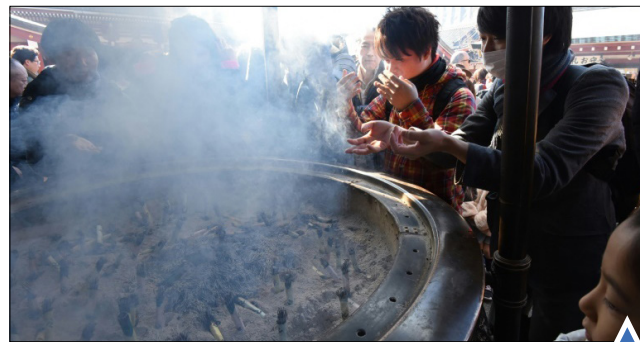
مراسم سال نوی میلادی در معبدی